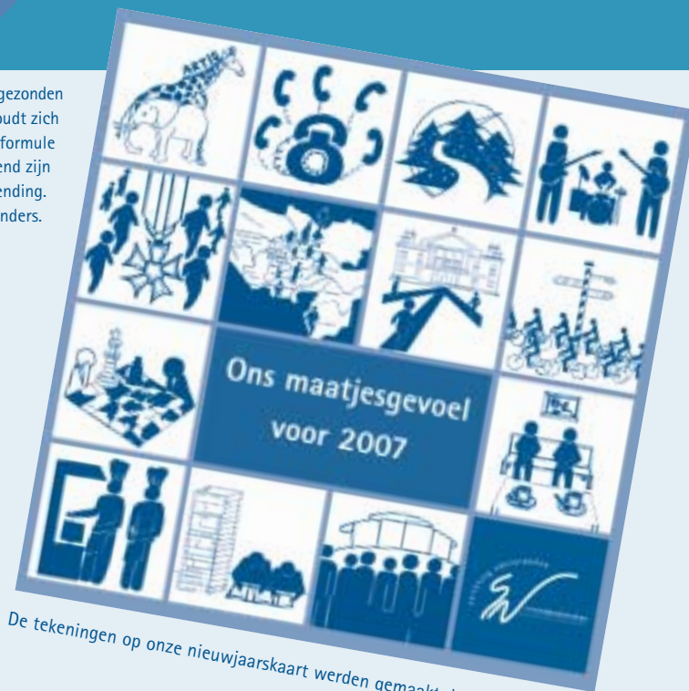
De tekeningen op onze nieuwjaarskaart werden gemaakt door Roos en Mint