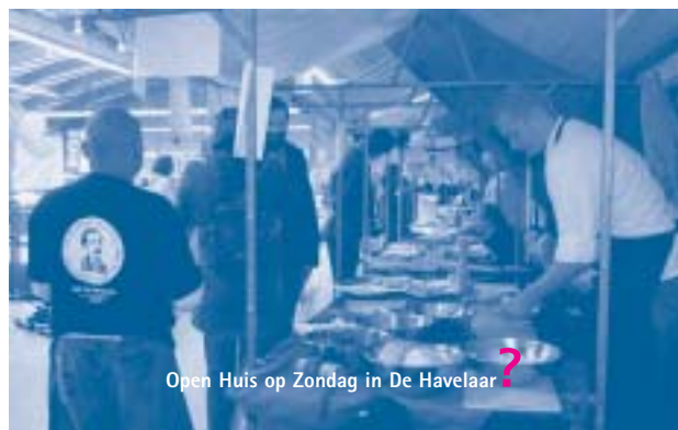
Open Huis op Zondag in De Havelaar ?

Vrijdag 24 november 2006 werd er in de sporthallen Zuid voor de eerste keer een informatiemarkt georganiseerd door Stichting De Omslag: de eerste Amsterdamse Participatiemarkt, voor mensen met psychiatrische klachten die zich willen oriënteren op dagbesteding, scholing of werk. Tientallen organisaties presenteerden zich. Er was voor elk wat wils: stappen bij het sportmaatjesproject van de SAV, creatief aan de slag bij de Kunstbende van De Waterheuvel, een praatje met Herman van de Homeservice of je paperassen laten ordenen bij de Repro van de SNWA.